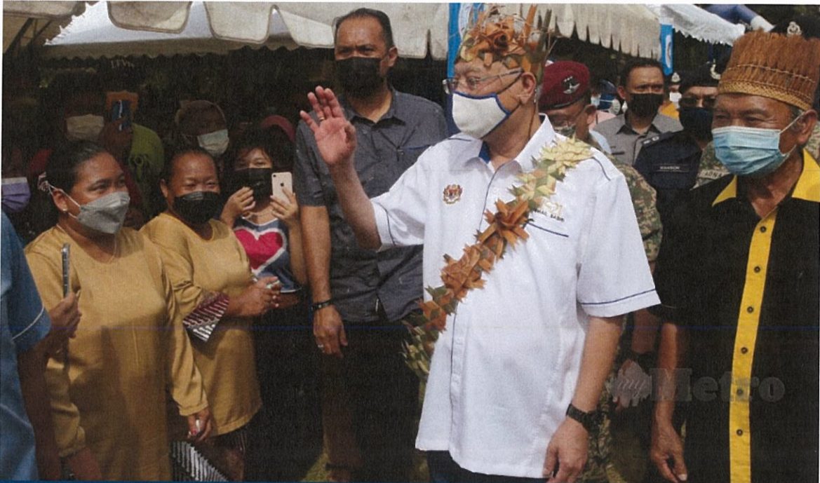
Ismail Sabri beramah mesra bersama komuniti Orang Asli sempena Program Khidmat Komuniti Bersama Universiti Pertahanan Nasional Malaysia (UPNM) dan Jabatan Kemajuan Orang Asli (JAKOA) di Sekolah Kebangsaan Bukit Rok.